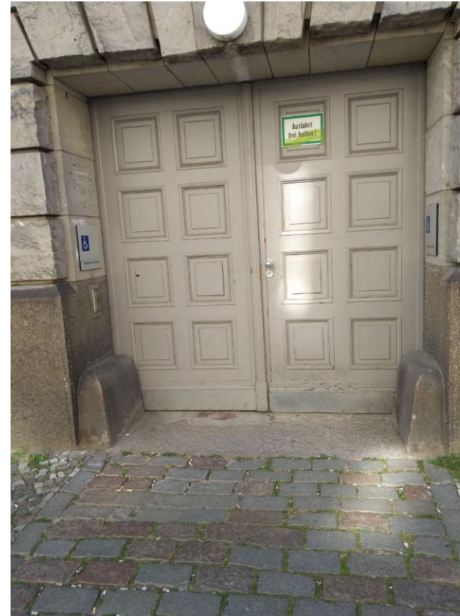
*1: Weg zum Fahrstuhl