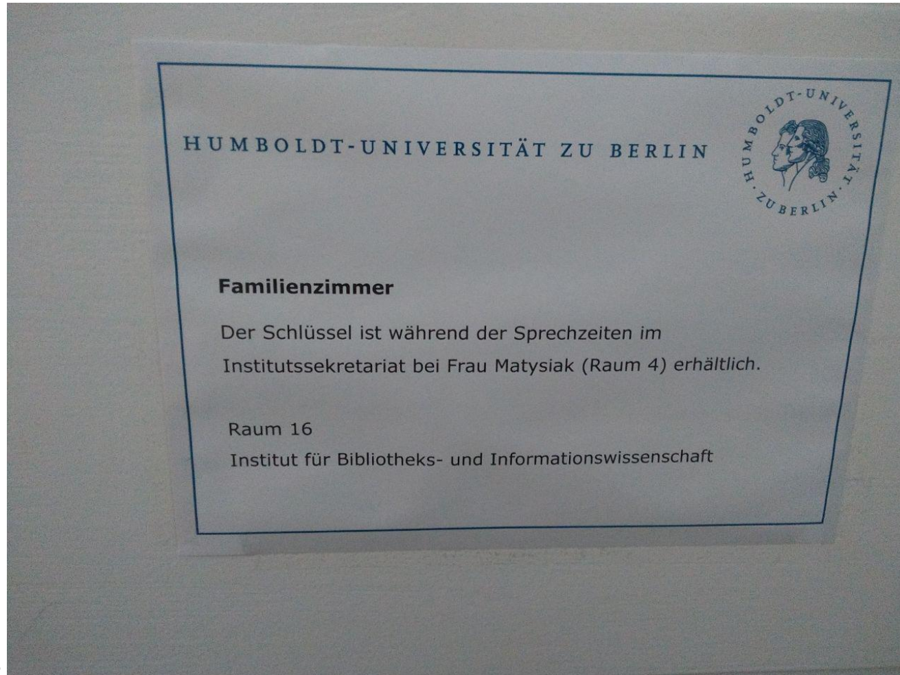
*3: Schild am Familienzimmer